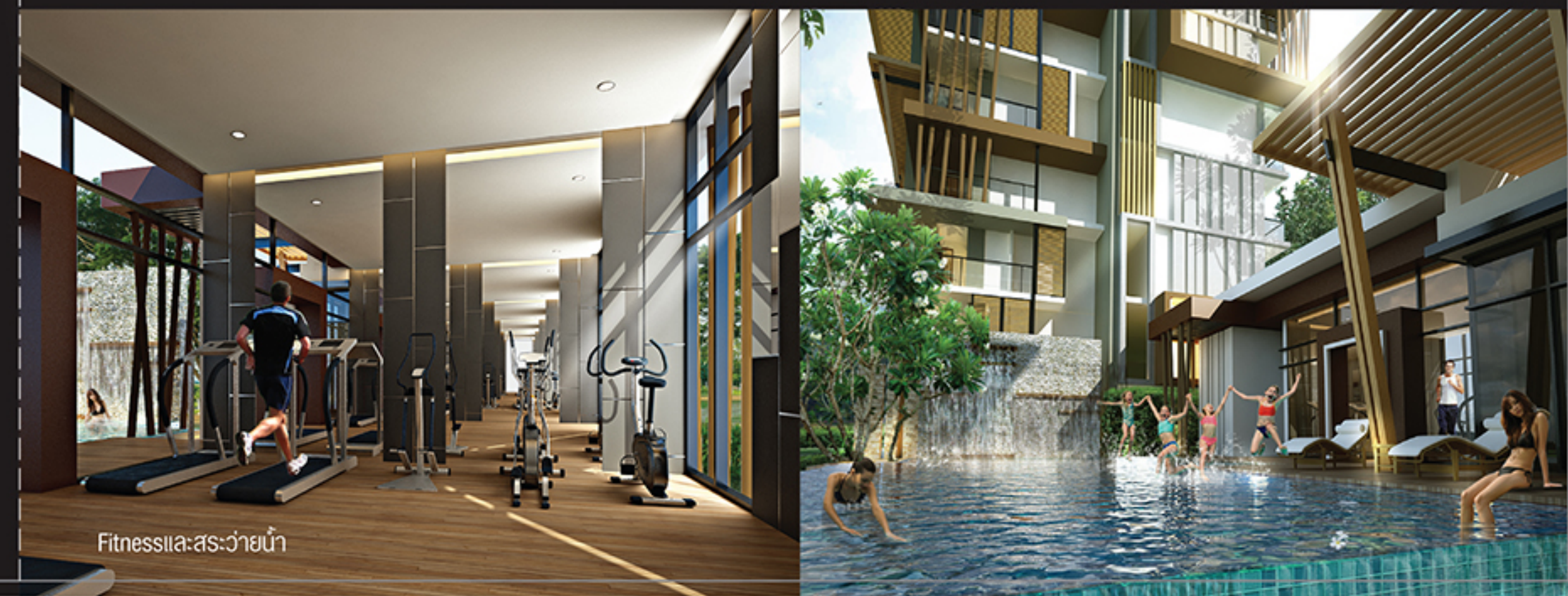
Fitnessและสระว่ายน้ำ

ทุกๆ Unit ประกอบด้วย “ห้องนอน” ที่กันเป็นสัดส่วน “ห้องครัว” ที่ให้ทุกคนสนุกกับการทำอาหารได้ทุก ๆ เวลา “ห้องน้ำ” ที่ให้ทุกคนได้ผ่อนคลายความเมื่อยล้าจากการทำงาน “มุมนั่งเล่น” ที่จะมีปาร์ตี้เล็กๆ กับครอบครัวหรือสนุกกับเพื่อนๆ