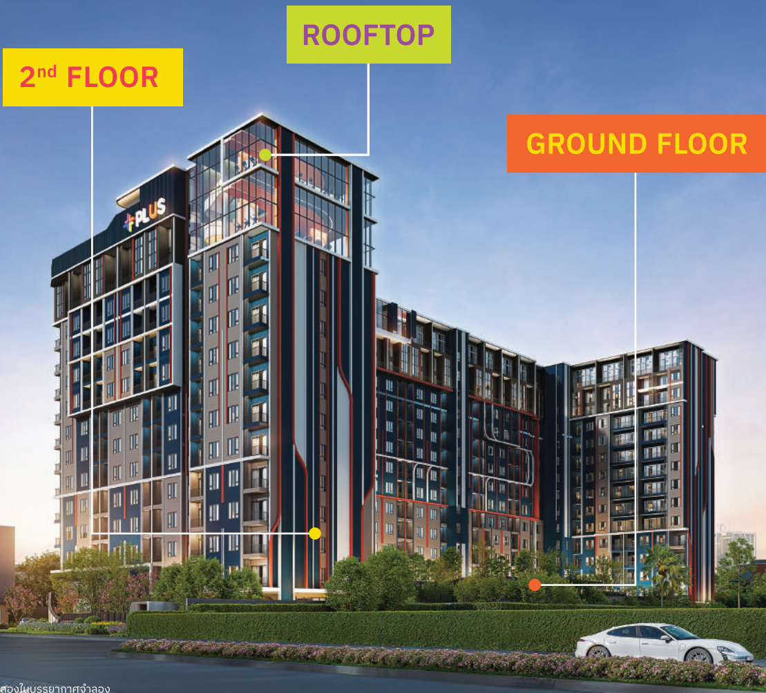
ການສະແດງໃນແບບສາທາລະນະ