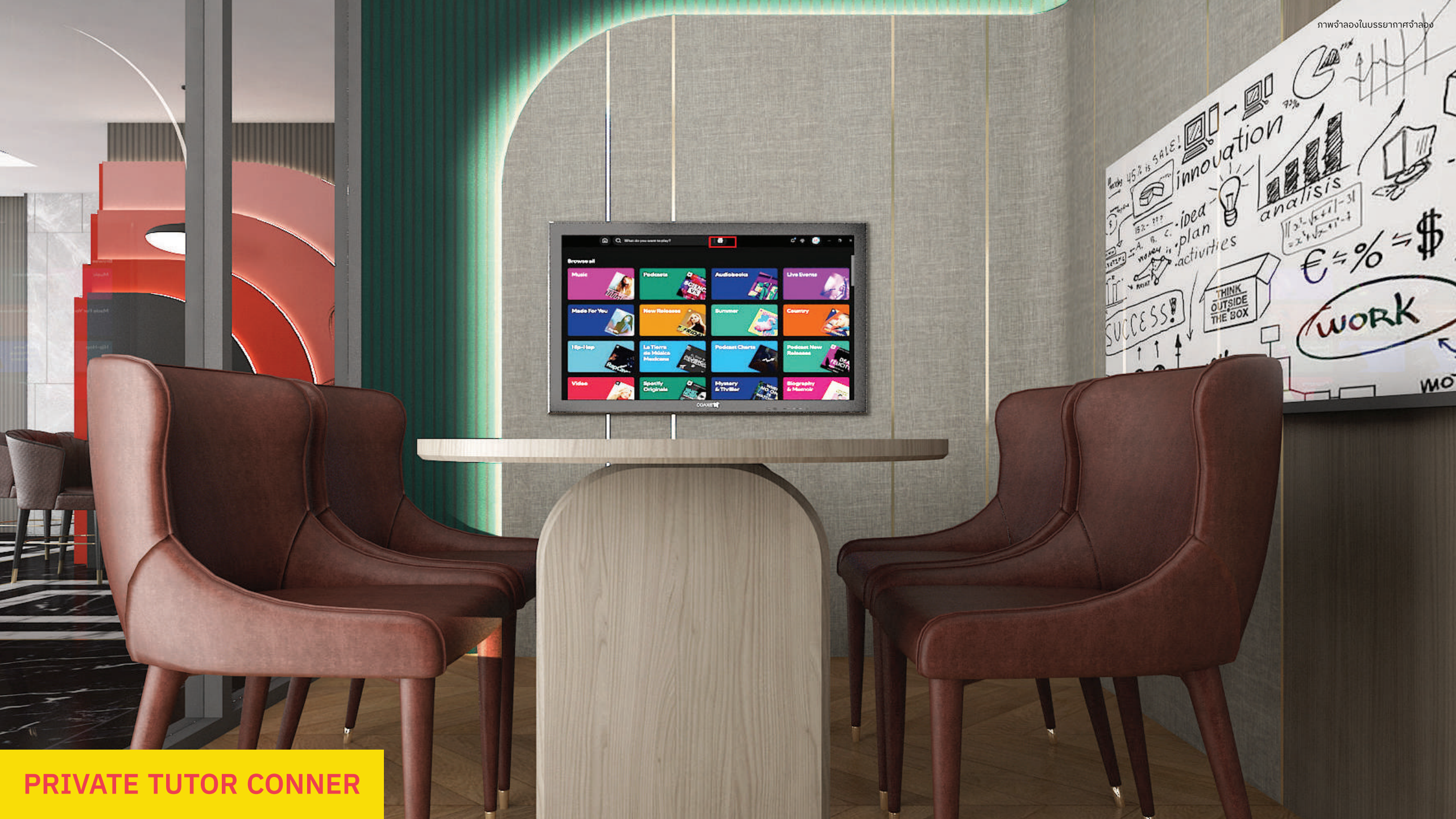
PRIVATE TUTOR CONNER