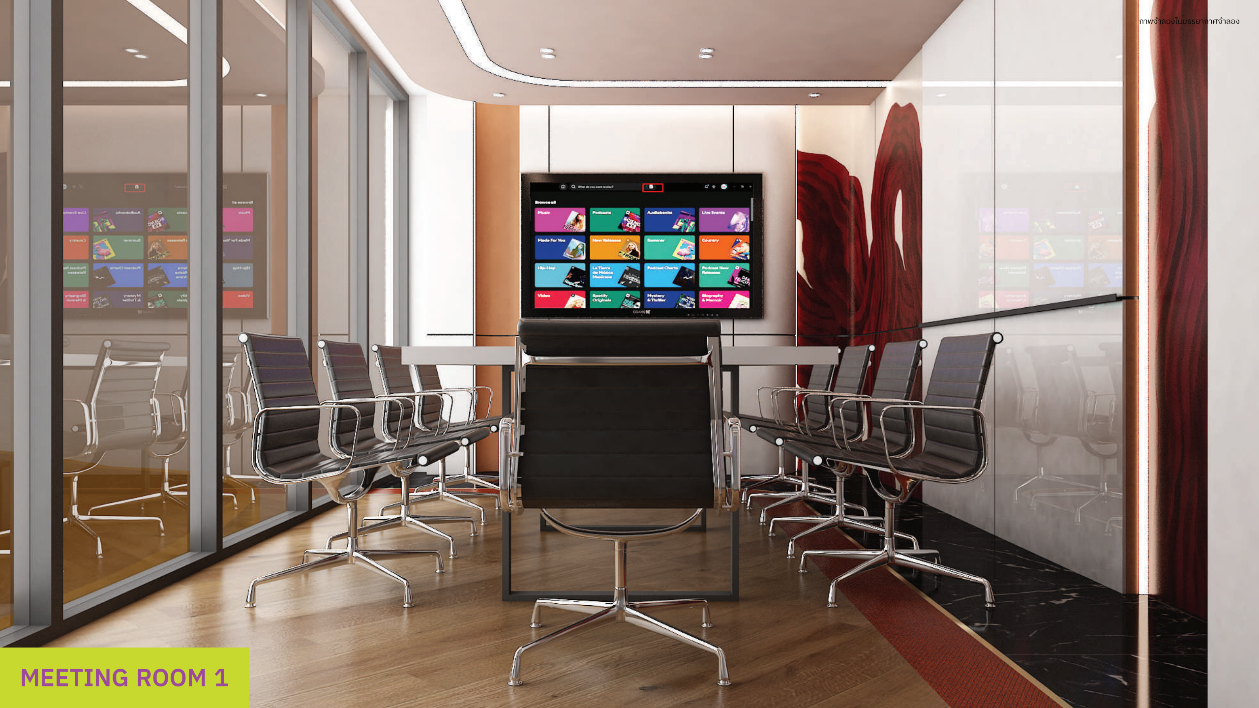
MEETING ROOM 1