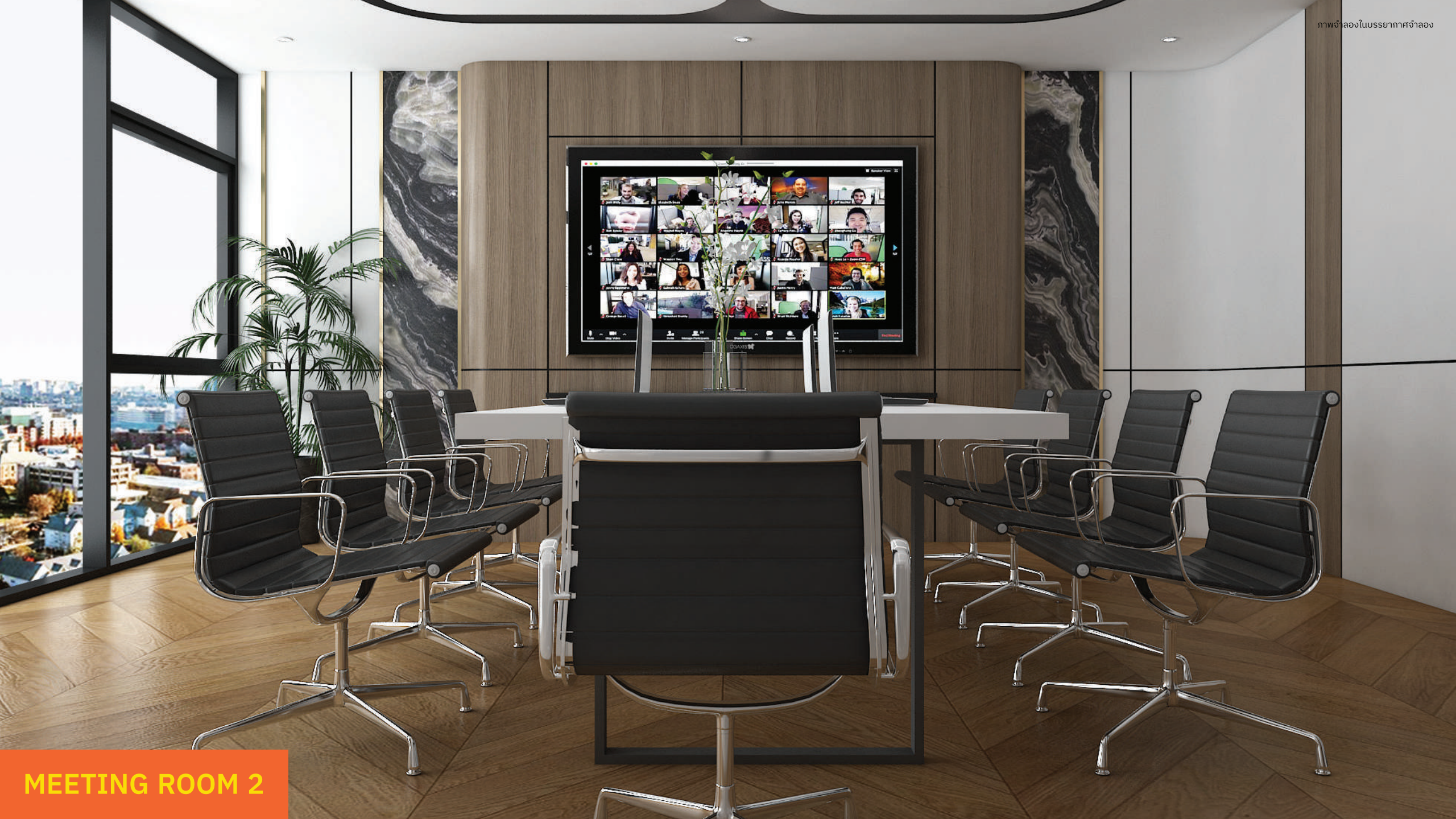
MEETING ROOM 2