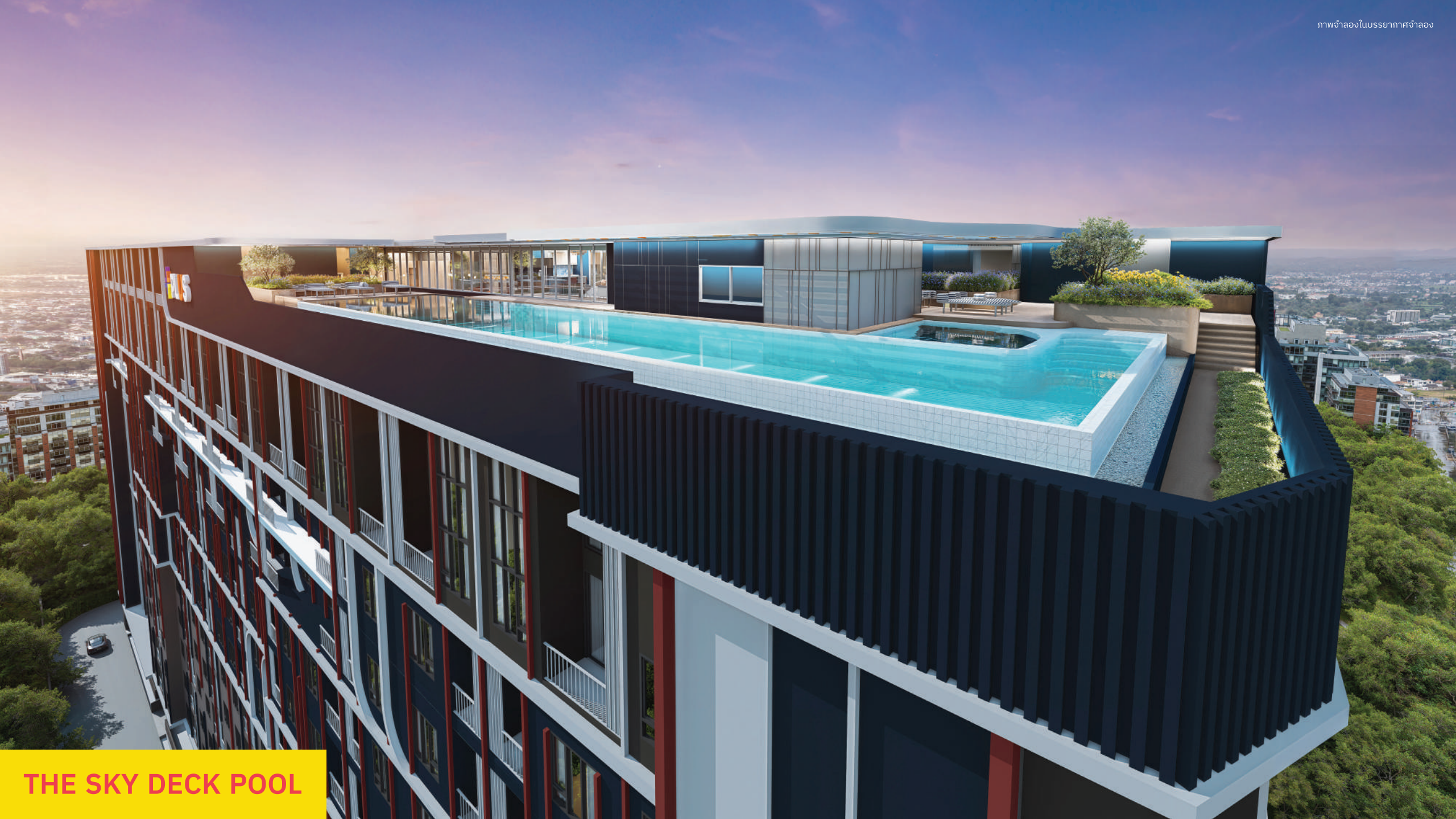
THE SKY DECK POOL