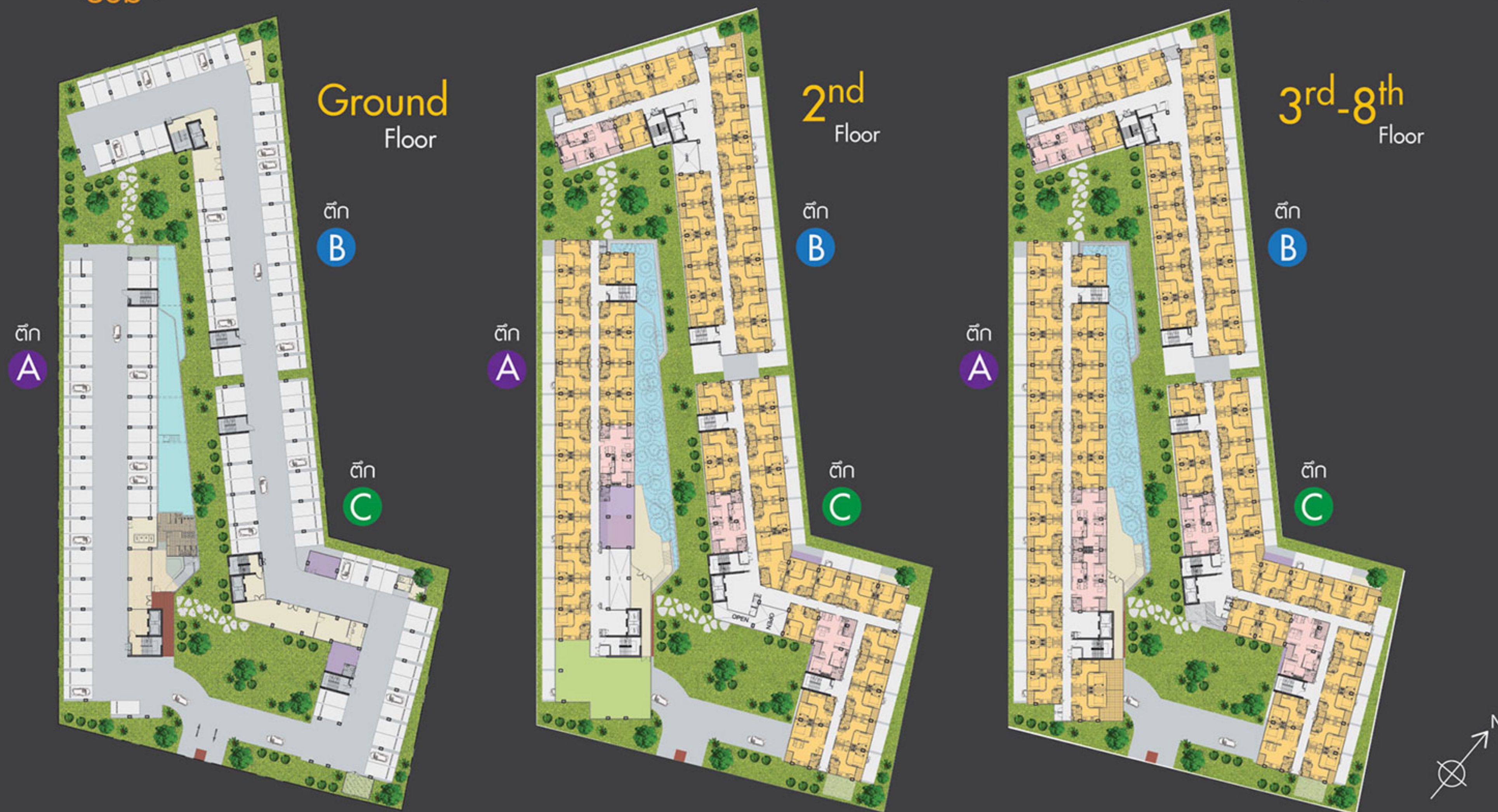
1 ห้องนอน 30 ตร.ม. BUILDING A,B,C